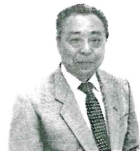
高掬地域社会福祉協議会